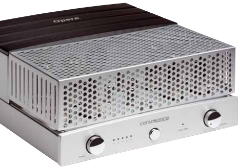
Der Deckel ist zwar eigentlich Pflicht, dürfte in der Praxis aber eher selten zum Zuge kommen