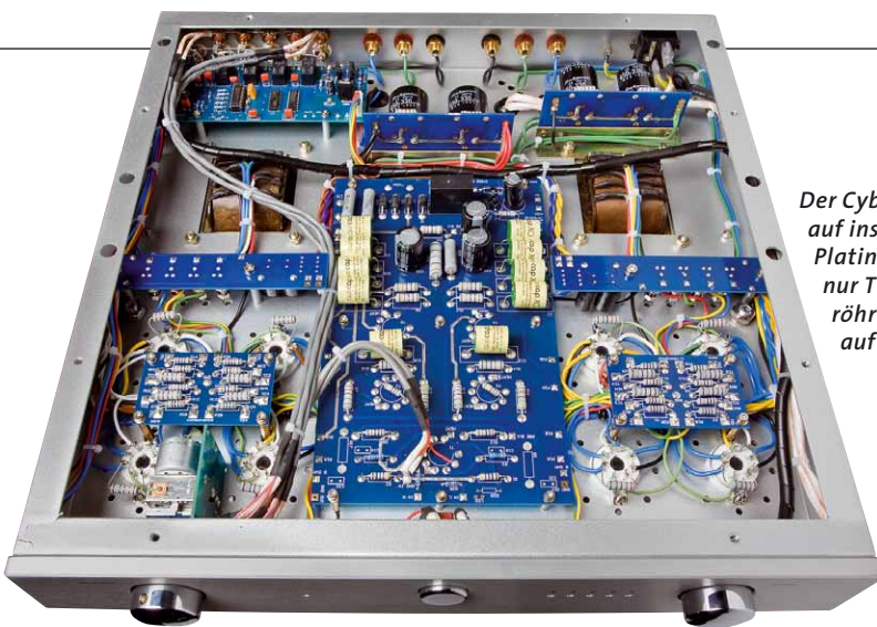
Der Cyber 880i ist auf insgesamt neun Platinen aufgebaut, nur Trafos und Endröhren sitzen direkt auf dem Chassis

sich von Technologie als Selbstzweck und sieht den eigenen Weg darin, weltweit nach den bewährtesten Konzepten zu suchen und diese soweit wie möglich zu optimieren.