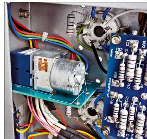
Die Lautstärke wird per Motorpoti eingestellt - das geht auch per Fernbedienung