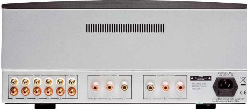
Die Rückseite bietet die üblichen Anschlussmöglichkeiten – und einen Vorstufenausgang

Eingangssignale werden vor Ort mittels Relais geschaltet