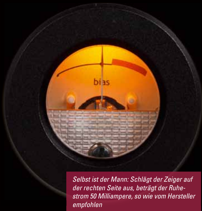
Selbst ist der Mann: Schlägt der Zeiger auf der rechten Seite aus, beträgt der Ruhestrom 50 Milliampere, so wie vom Hersteller empfohlen

Cyber 880i ist ein Name, der zunächst nicht auf einen Röhrenvollverstärker schließen lässt. Dabei hat die Namensgebung bei Opera Audio Consonance mittlerweile Tradition, wie der aufmerksame Leser bereits in der Vergangenheit lesen konnte. Der Cyber 880i des fernöstlichen Röhrenspezialisten ist mit seinen 28 Kilogramm wahrlich kein Leichtgewicht, benötigt ausreichend Platz mit ordentlicher Belüftung im Hi-Fi-Rack und ersetzt zur kühlen Jahreszeit gern einmal die Heizung. Räumt man dem Gerät den benötigten Platz ein, erhält man einen optisch auffälligen Röhrenverstärker mit Vollaluminiumgehäuse und schwarz-lackierten Aluminiumleisten oberhalb der Trafoabdeckung. Zwei Drehregler zur Lautstärkesteuerung und Eingangsauswahl sowie eine 5-Stufige-LED-Anzeige zieren die Frontleiste. Auf der Rückseite finden wir die fünf passenden vergoldeten Analogeingänge.